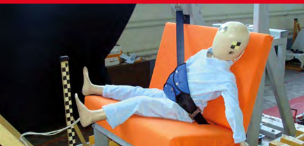
Результаты тестов использования небезопасных удерживающих устройств*

Дополнение определения «направляющая ляжка» в Правилах ЕЭК ООН № 44-04 было одобрено Всемирным Форумом (WP.29). Внесенная поправка к формулировке указывает на то, что «направляющая ляжка» рассматривается как составной элемент детской удерживающей системы и НЕ может отдельно официально утверждаться в качестве детской удерживающей системы в соответствии с настоящими Правилами». Это исключает даже формальную возможность сертификации устройств типа «направляющая ляжка»!