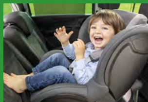
Автокресла групп I (для детей массой 9-18 кг)*