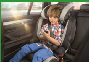
Автокресло группы II и III (для детей массой 15-36 кг)