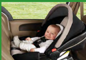
Автокресло группы 0+ (для детей массой < 13 кг)*