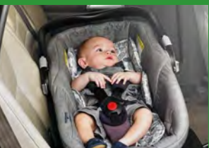
Автокресло «люлька» группы 0 (для детей массой < 10 кг)*

При покупке детского удерживающего устройства обязательно следует уточнить у продавца наличие сертификата на товар!